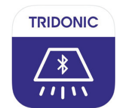
App - 4remote BT