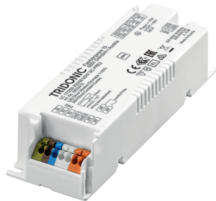
basicDIM Wireless Integrated driver