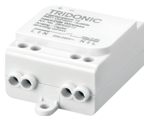
basicDIM wireless Module